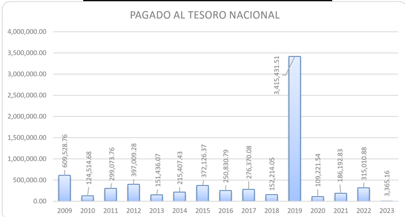
TRIBUNAL DE CUENTAS PAGOS AL TESORO NACIONAL (DEL 1 AL 31 DE ENERO DEL 2023)